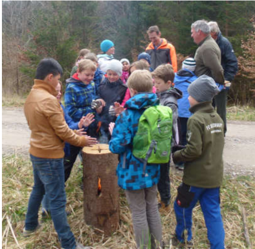
Aufwärmen am Schwedenfeuer