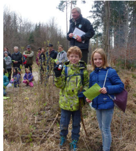
Die beiden stolzen Sieger des Baum-Schätzwettbewerbs

Danach gab es einen Wettbewerb im Schätzen des Alters einer mächtigen Fichte und es wurden noch einige junge Bäumchen gepflanzt. Zum Aufwärmen hatte Georg Hausmann ein Schwedenfeuer entzündet. Mit einer ökumenischen Andacht wurden die Kinder in die Ferien entlassen.